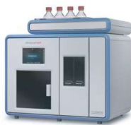
EXTRATOR DE SOLVENTES E EVAPORADOR