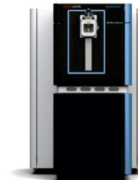
ORBITRAP (ALTA RESOLUÇÃO)