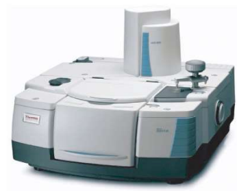
FTIR MID/ NEAR/ FAR-IR