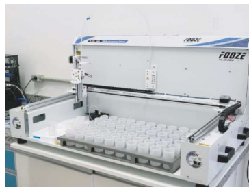
FZ-100 ARM- DSP