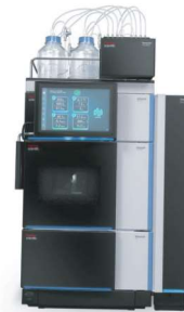
CROMATÓGRAFO À LÍQUIDO (LC)