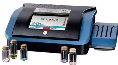
ANALISADOR DE UMIDADE

Substitua o Karl Fischer por uma análise simples, rápida, sem uso de reagentes e com menor custo operacional.