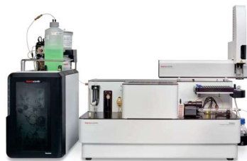
IC + COMBUSTÃO