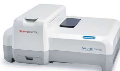
UV/VIS - PESQUISA