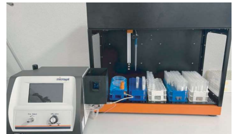
Fotômetro de chama com autosampler