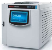
CROMATÓGRAFO À GÁS (GC)