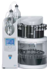
EXTRATOR ACELERADO DE SOLVENTES