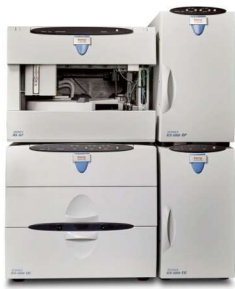
CROMATÓGRAFO DE ÍONS (IC)