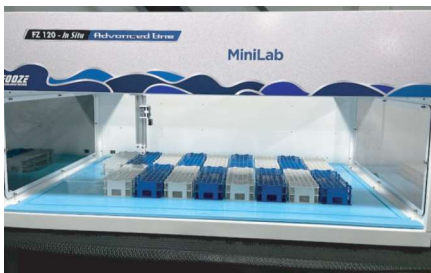
FZ-120 (possui modelo SPEC ou RTR - retrabalho)