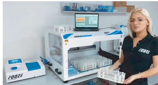
BANDEJA 60 posições (rack) p/ tubo de 15 ml