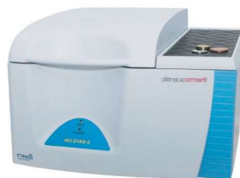
FLUORESCÊNCIA DE RX (EDXRF)