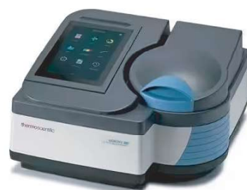
UV/VIS - ROTINA