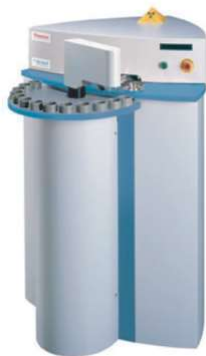
FLUORESCÊNCIA DE RX (WDXRF) SEQUENCIAL / SIMULTÂNEO