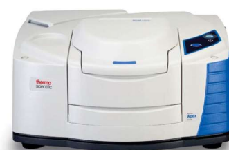
FTIR MID/ NEAR-IR