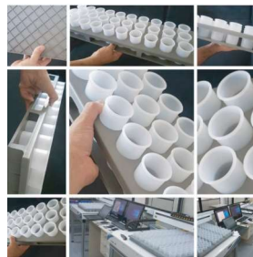
FZRAC-30-ETR (bandeja para extração)