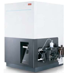
ICP-MS / ICP-MSMS