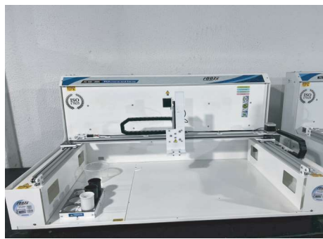
FZ-100 ARM - PH (leitura de ph)