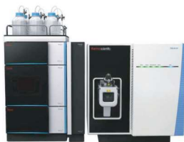
LC-MS / LC-MSMS