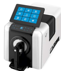
COLORÍMETRO DE BANCADA E PORTÁTIL