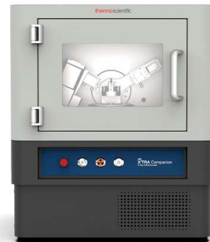
DIFRATÔMETRO DE RX (DRX)