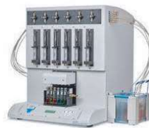
EXTRATOR DE FASE SÓLIDA