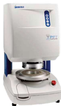
ANALISADOR DE FLUXO DE PÓ

Substitua o Karl Fischer por uma análise simples, rápida, sem uso de reagentes e com menor custo operacional.