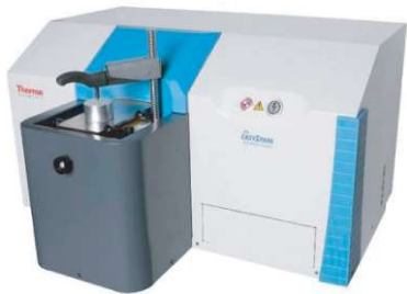
ESPECTRÔMETRO DE EMISSÃO ÓPTICA (OES)